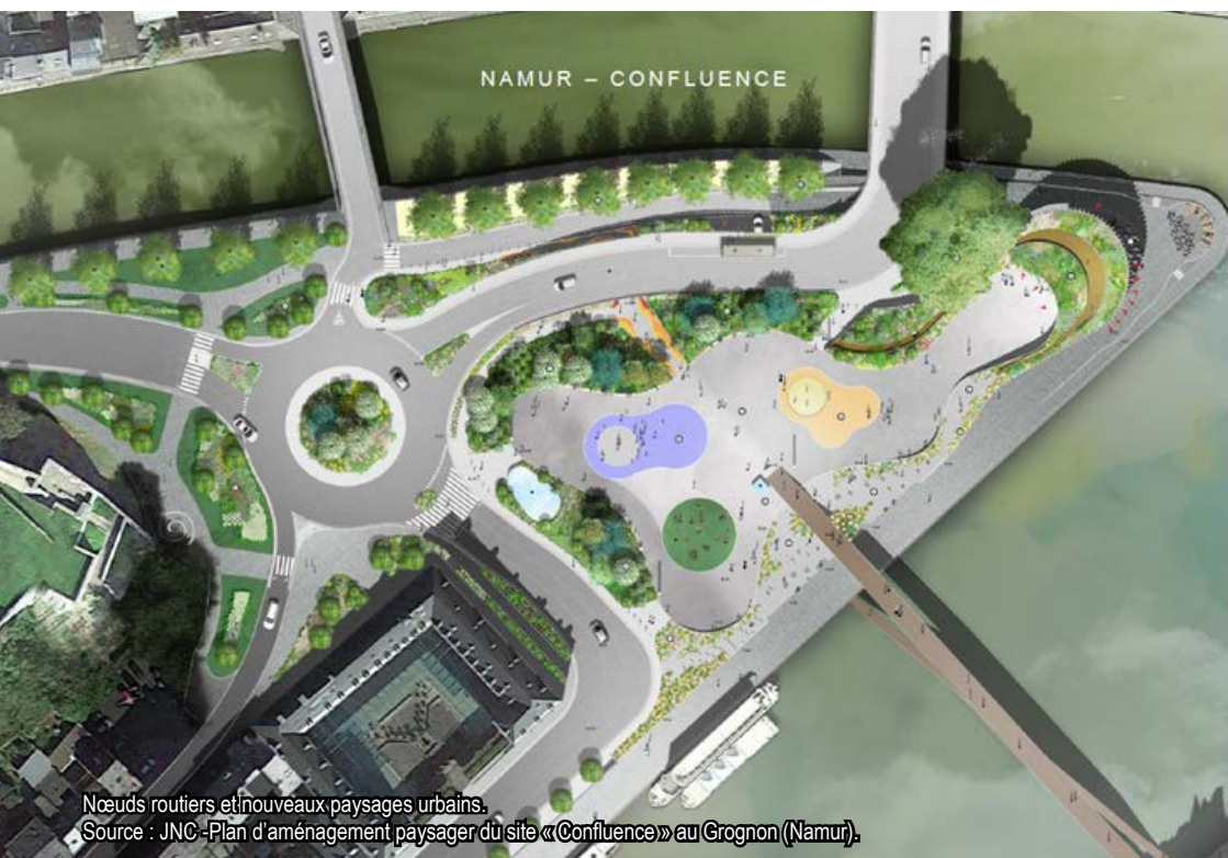
Nœuds routiers et nouveaux paysages urbains. Source : JNC - Plan d'aménagement paysager du site « Confluence » au Grognon (Namur).