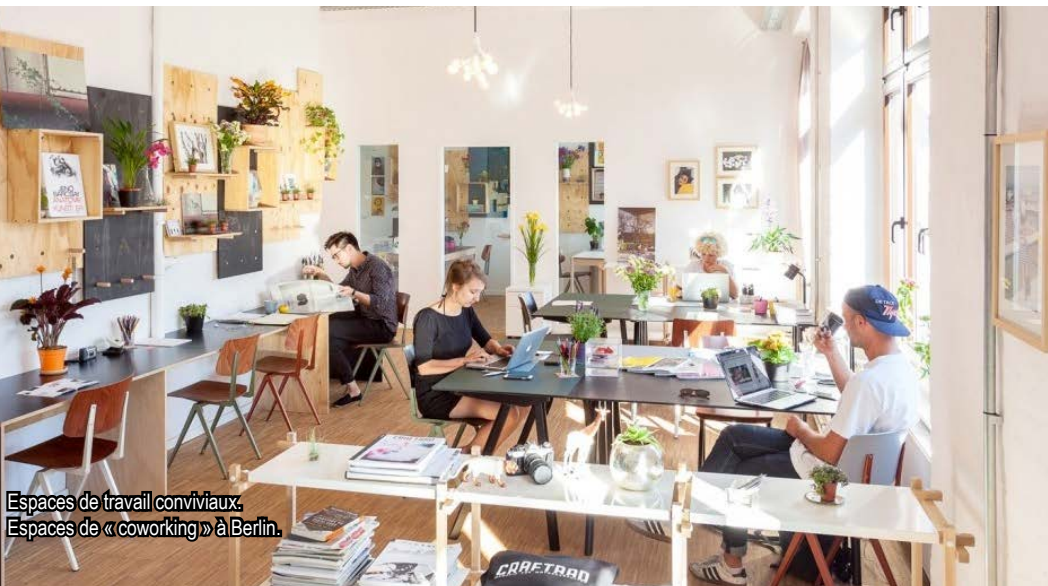
Espaces de travail conviviaux. Espaces de « coworking » à Berlin.

Cette gestion économique/écologique des logements et du territoire devra également intégrer, dans les nouveaux projets de quartiers et de logements, les usages citoyens de plus en plus présents tels que les voitures ou les vélos partagés.